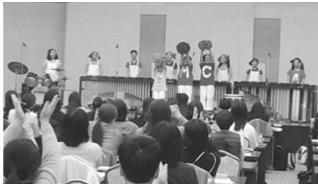
→広島ジュニアマリナーアンサンブルの演奏で盛り上がる会場

子どもたちによりよい保育を行える保育条件の更なる改善と職員が健康で働き続けられる労働条件の改善を行っていくことを確認し合い、集会を終えました。