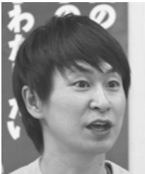
広島市社会福祉事業団 労組

2月19日(水)広島自治労連からオンライン併用で、連続学習会「聞いて、知って、私たちの仕事」の第6回を開催し、会場10名、オンライン39名と多くの参加がありました。