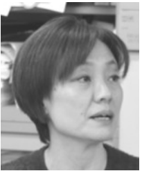
広島市職労学校給食調理員協議会