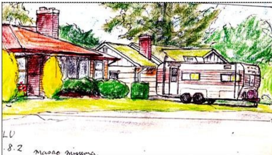
キャンピングカー

仲間の多くは、キャンパスに向かったが、私は別行動を取ることにして、大学周辺でジョギングし、気に入った題材があったらスケッチすることにした。池の近くをジョギングしている時、そこに水上飛行機が浮かんでいるのが目に入った。