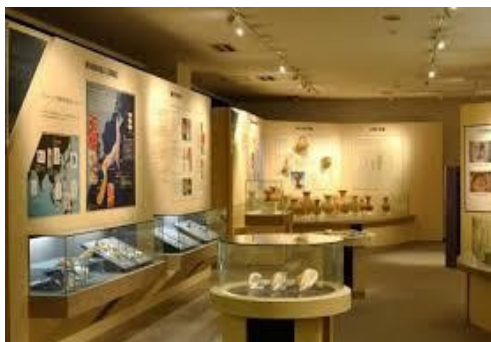
土井ヶ浜遺跡・人類学ミュージアム

楽しく分かりやすい展示と館長さん直々の噛み砕いた解説との相乗効果で、私の頭の中にも、今まで知らなかったことがガンガン飛び込んで来ました。