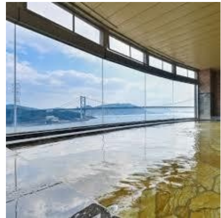
海峡ビューしものせき

13時30分に学習交流会が始まりました。最初に、県単位で各3分が割り当てられ、お互いの自己紹介を行いました。