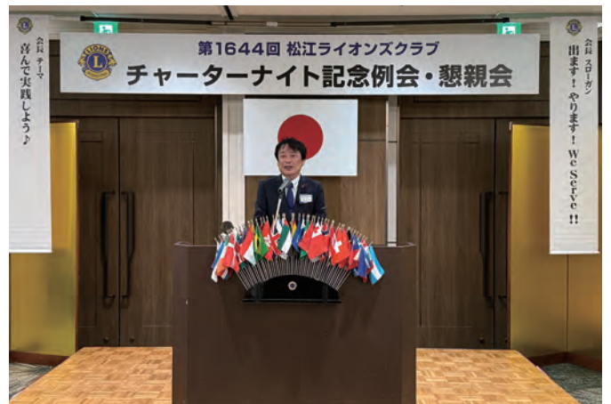
尾道LC山根会長挨拶