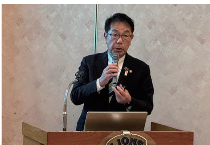
ゲストスピーチ 尾道市長 平谷 祐宏 様