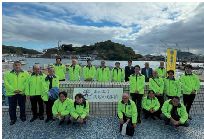
おのみち海辺の美術館前にて